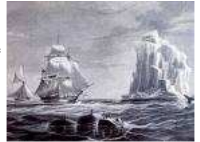
Bateaux "Beaufoy" et "Jane"

L'écosais William S. Bruce l'explora presque entièrement entre 1902 et 1904.