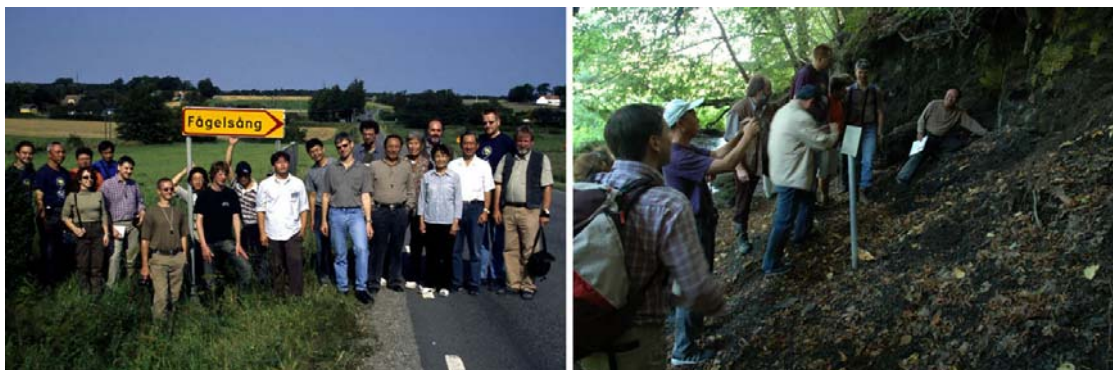
Figure 2 : Visite du GSSP de la limite Ordovicien moyen / Ordovicien supérieur (Fågelsång, Suède) par les participants à l'excursion post-conférence du symposium international "Early Palaeozoic Palaeogeography and Palaeoclimate" organisé par le PICG 503 à Erlangen (Allemagne, septembre 2004).

A l'automne 2001, l'ISOS désigne la FAD du graptolite Nemagraptus gracilis comme marqueur de la base de l'Ordovicien supérieur. Suite à la proposition formulée par Bergström et al. (2000), le GSSP correspondant à la limite Ordovicien moyen / Ordovicien supérieur est formellement placé sur la coupe de Fågelsång (Fig. 2), à proximité de Lund, en Suède (décision plébiscitée par 100% des suffrages; Finney 2002). Ainsi définie, la limite entre Ordovicien moyen et Ordovicien supérieur correspond exactement à celle entre le Llanvirn supérieur (Llandeilien) et le Caradoc en Grande-Bretagne (Fortey et al. 1995).