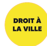
GT Droit à la ville

Groupe étudiant, département de Sociologie, UBO