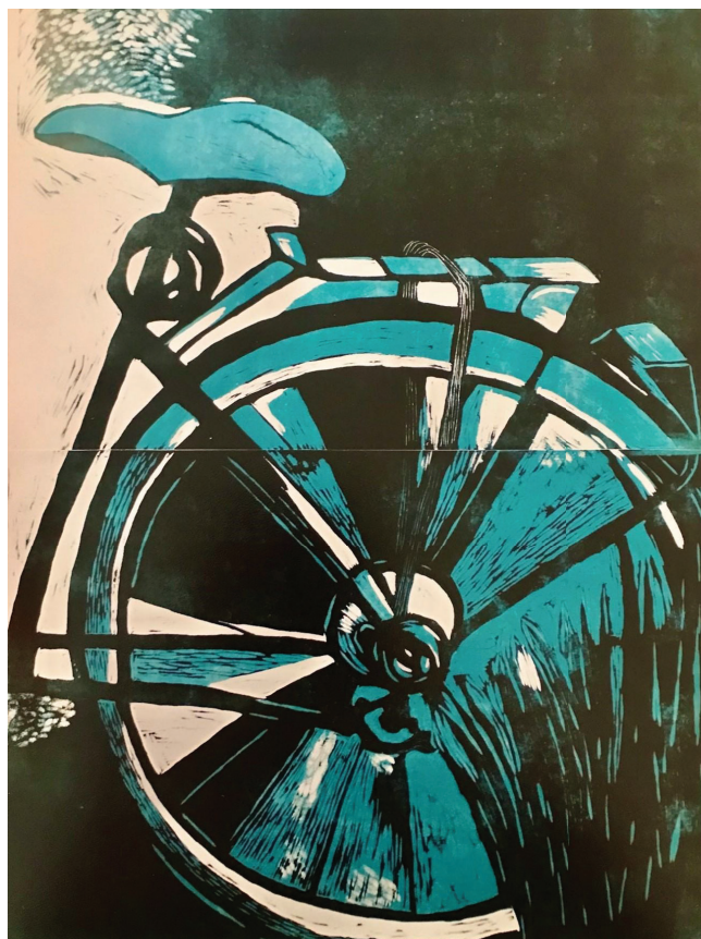
Gravure sur bois tirée de l'exposition Partager la nuit (2024) ↓

Par ailleurs, des étudiantes du Master 1 Psychologie (parcours RESPI, UBO), encadrées par le LP3C, explorent les pratiques festives nocturnes à Brest. Depuis l'automne 2024, elles interrogent par questionnaire des jeunes usagè·e·s (18-30 ans) de la nuit festive afin de recueillir leurs vécus et expériences. Il s'agit d'identifier la façon dont ces usagè·e·s se représentent ce que c'est que « faire la fête », quels sont leurs intérêts et leurs activités lorsqu'elles sortent le soir à Brest. L'enquête vise ainsi à cartographier leurs pratiques nocturnes festives en termes de lieux et d'espaces de rencontre dans Brest, d'horaires et de formes prises par leurs déplacements. Les comportements sécuritaires mis en œuvre ou non par ces usagè·e·s sont également questionnés en faisant le lien avec les dispositifs proposés par la ville de Brest.