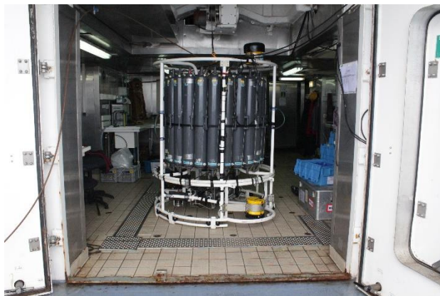
Rosette utilisée pour RESILIENCE

Par essence, RESILIENCE est une mission pluridisciplinaire (et internationale) qui couvrira une grande diversité de mesures en mer. Les observations à fine échelle seront réalisées en tractant un système ondulant (MVP, entre 0 et 300 m) muni de capteurs des paramètres d'intérêt. Ces observations seront complétées par des profils verticaux (CTD) en station au cours desquels seront également effectués des prélèvements d'eau (mesures biogéochimiques) et de plancton (phyto et zooplancton) à différents niveaux de profondeur. Des techniques modernes de prélèvement et