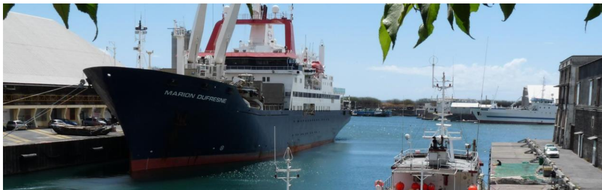
Navire Marion Dufresne

Les scientifiques de France (MARBEC, ENTROPIE, LEMAR, LOCEAN, LOG, LOPS, MIO), d'Afrique du Sud (3 Universités - Qqeberha, Cape Town, Stellenbosch), du Mozambique, du Royaume Uni et des Etats-Unis accueilleront une Université Flottante (20 étudiants et 2 encadrants, des Universités de Bretagne Occidentale (UBO), du Littoral Côte d'Opale (ULCO) et de Côte d'Azur (UCA).