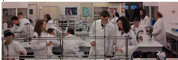
Olympiades de la chimie – Brest – Nov. 2013

Le concours « Olympiades Nationales de la Chimie » (ONC) est une compétition à vocation éducative à destination des terminales S et STL, qui se déroule en deux temps au niveau régional, puis au niveau national. Cette année ce sont 20 élèves qui se sont inscrits et qui préparent ce concours dont le thème est «Chimie et sport». La préparation prend la forme de TP, réalisés entre octobre et décembre 2013, sur les thèmes suivants : «Matériaux et nanomatériaux du sport », «Boissons énergisantes », « Dopage aux JO de Londres – Une intrigue à résoudre » et «Blessures du sport ». Le concours écrit aura lieu à Brest le mercredi 22 janvier 2014. L'organisation des Olympiades de la chimie est financée par l'UFR Sciences, le département de chimie et l'Union des Industries Chimiques Ouest-Atlantique.