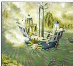
Remedios Varo - Trasmundo - 1959 / Paradero desconocido.

DISCIPLINE : ESPAGNOL Civilisation de l'Amérique Latine